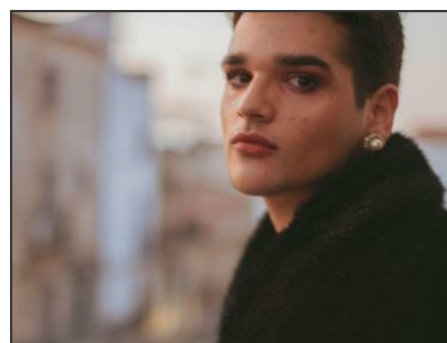
Cumpleaños feliz, ganador a Mejor Interpretac..