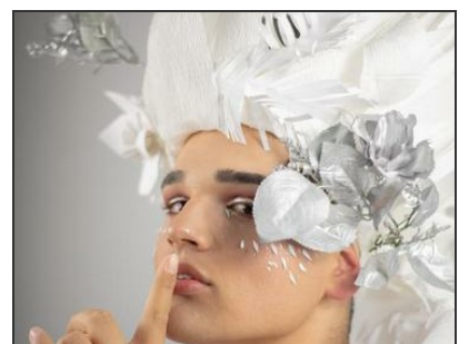
Pequeña muestra de mi trabajo fotográfico.