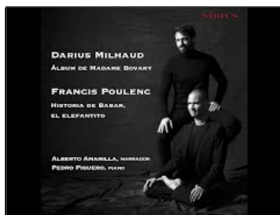
Teaser realizado por mí.

Trabajo audiovisual que he ido creando durante mis 20 años.